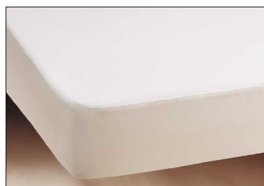
Molton matrashoes k200