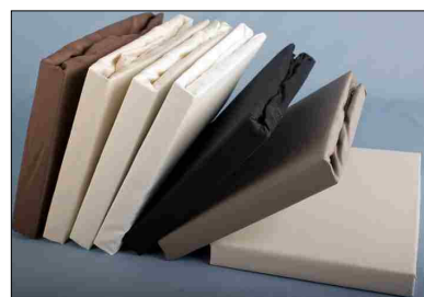
Ook als topper verkrijgbaar

Kreukherstellend, voorgekrompen en kleurecht 3 jaar garantie